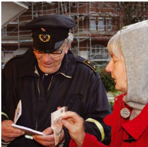
Lørdag den 6. december 2009 på torvet på Ingerslev Boulevard: For sidste gang solgtes lodsedler til fordel for Brandmændenes Julelotteri.